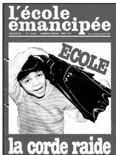
Numéro spécial, 1983.

Nous ne reviendrons pas sur les mises à pied, déplacements d'office, absence de promotions que leur lutte syndicale déclencha. Jusque dans les années 1920, les syndicalistes de l'enseignement restèrent une minorité, mais cet engagement précoce par rapport aux autres pays, permit le déploiement d'un syndicalisme de masse dès la fin des années 20 où les anciennes amicales se rallièrent par étape au syndicalisme ouvrier réformiste. L'engagement des instituteurs leur permit d'avoir des responsabilités importantes dans le mouvement ouvrier et enracina pour longtemps (jusqu'à nos jours) l'Ecole Emancipée dans le paysage syndical de l'Education nationale.